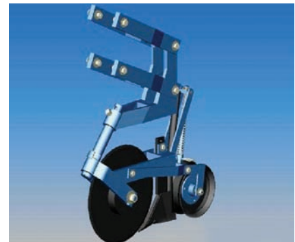
Módulo de fertilización